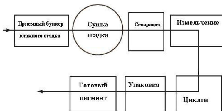
Рис. 1. Принципиальная схема получения сурикоподобных пигментов на основе ЖСО [2].

В работах [19, 21] показана возможность использования сорбентов на основе ЖСО (станция водоподготовки водозабора Томского Академгородка) и алюмосиликатных микросфер (образующихся при сжигании угля на ТЭС) для очистки сточной воды от нефтепродуктов и фенола. ЖСО, во влажном состоянии представляющий собой гелеобразную массу светло-коричневого цвета, при высыхании твердеет в виде агломератов, которые легко растираются в тонкодисперсный порошок, обладающий полидисперсным составом. Основу порошка составляют частицы средним размером 0,032 мкм, а размеры агрегатов, образующихся в результате слипания первичных частиц, находятся в пределах 0,368–1,72 мкм. Основная минеральная фаза осадка представлена гидратированным (аморфным) оксидом трехвалентного железа – Fe_2O_3 \cdot x(H_2O)_n . Высокие сорбционные свойства ЖСО определяются его пористостью, развитой удельной поверхностью и наличием активных центров, представляющих собой оксидные и гидроксидные группы. При прокаливании осадка наблюдается снижение его удельной поверхности, что обусловлено удалением межкрасочной воды и последующим слипанием и формированием более крупных частиц (табл. 2).